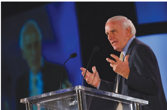
จิม รอห์น (Emanuel James Rohn)

รายงานฉบับนี้จัดทำขึ้นโดยข้อมูลเท่าที่ปรากฏและเชื่อว่าเป็นที่น่าเชื่อถือได้แต่ไม่ถือเป็นการยืนยันความถูกต้องและความสมบูรณ์ของข้อมูลนี้ โดยบริษัทหลักทรัพย์ ยูโอบี เคย์ ฮียน (ประเทศไทย) จำกัด (มหาชน) ผู้จัดทำขอสงวนสิทธิ์ในการเปลี่ยนแปลงความเห็นหรือประกาศการณ์ต่างๆที่ปรากฏในรายงานฉบับนี้ โดยไม่ต้องแจ้งล่วงหน้า รายงานฉบับนี้มีวัตถุประสงค์เพื่อใช้ประกอบการตัดสินใจของนักลงทุน โดยไม่ได้เป็นการชี้นำชักชวนให้นักลงทุนทำการซื้อหรือขายหลักทรัพย์ หรือตราสารทางการเงินใดๆ ที่ปรากฏในรายงาน